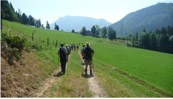
Richtung Lackenhof mit Blick auf den Ötztal