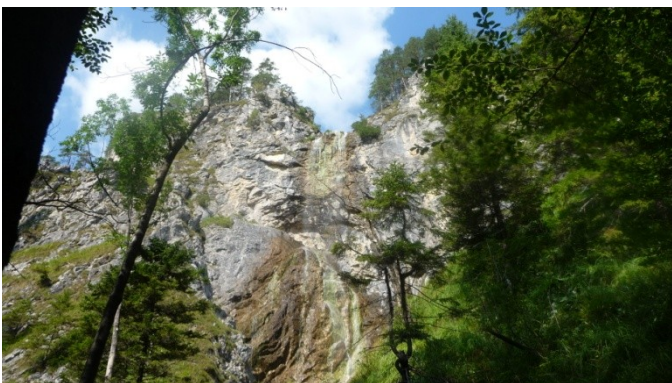
In den Ötztalgräben